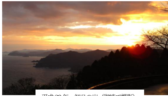
平成 29 年 初日の出 (御崎で撮影)

旧年中は、保護者の皆様、地域の皆様の協力とご支援をいただきながら、教育活動を進めることができました。